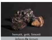
hematit, getit, limonit željezo Fe ferrum