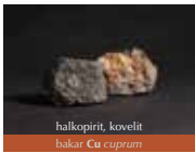
halkopirit, kovelit bakar Cu cuprum