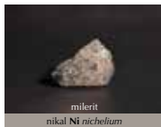
milerit nikal Ni nichelium