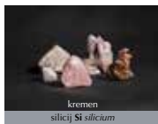
kremen silicij Si silicium