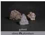
galenit olovo Pb plumbum