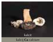
kalcit kalcij Ca calcium