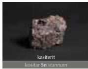
kasiterit kositar Sn stannum