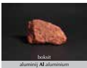
boksit aluminij Al aluminium