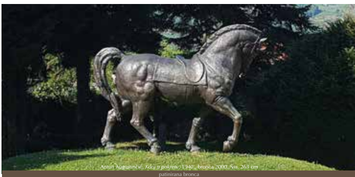
Antun Augustinčić, Kanji u pokretu , 1940., bronca 2000., vis. 263 cm patinirana bronca