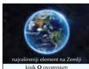
najrašireniji element na Zemlji kisik O oxygenium