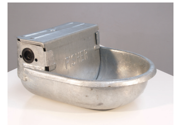
Božidar Pejković FONTANA (PISHER, POSVETA DUCHAMPOVOJ FONTANI) 2012. redimejd (konjska pojilica Fisher )